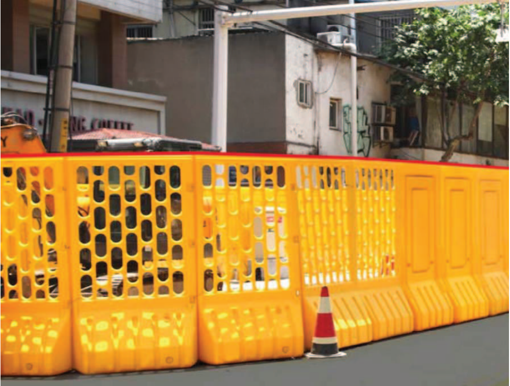
交叉路口设置C2通透型高水马参考图