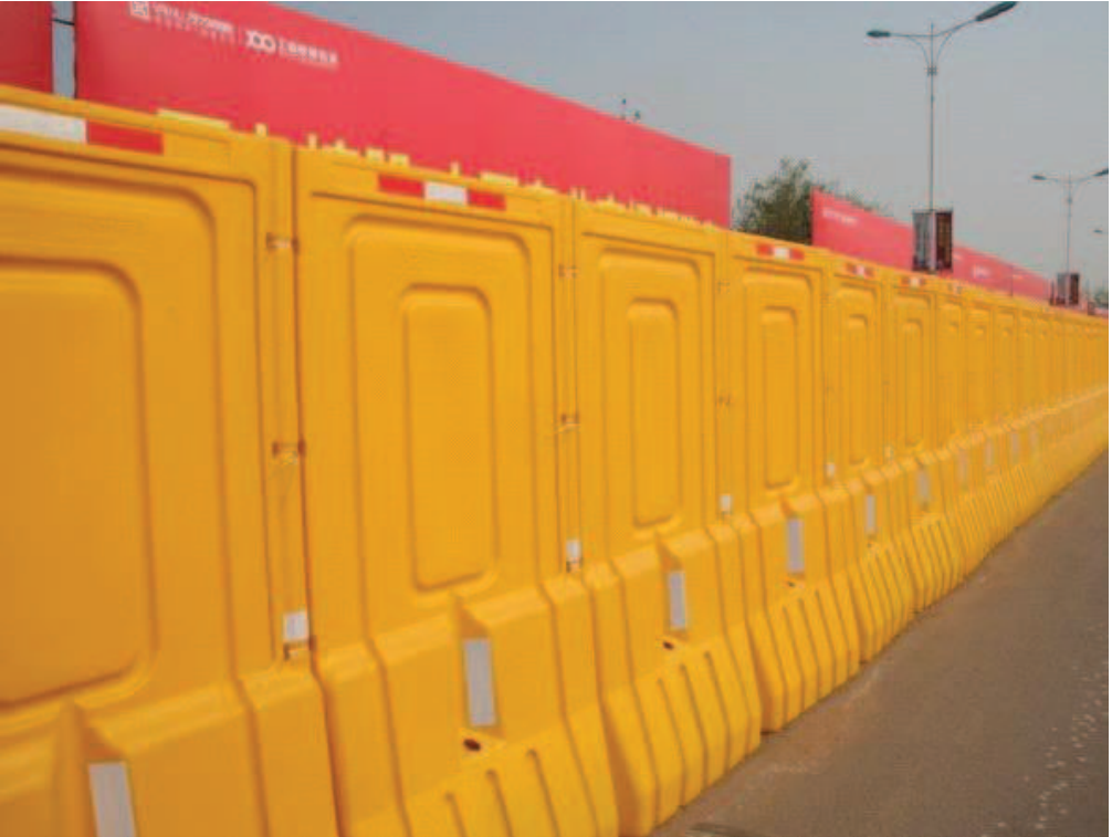
C2 型高水马组合参考图