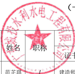
(一) 项目管理机构组成表