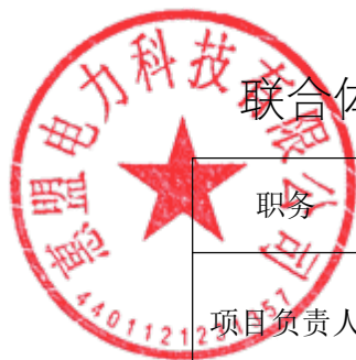
联合体设计成员项目管理机构组成表