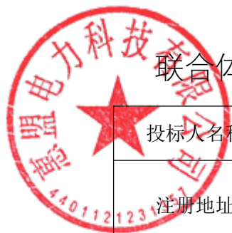
联合体设计成员基本情况表