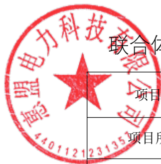
联合体设计成员近年完成的类似项目情况表