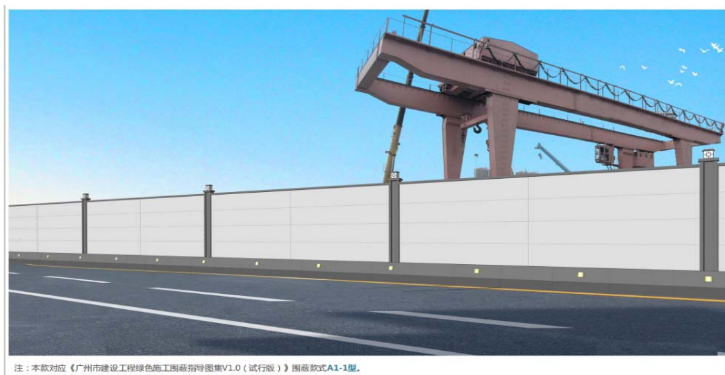
《广州市建设工程绿色施工围蔽图集（V2.0 版）》装配式临时活动式围蔽样式

采用角码与螺栓固定。主立柱采用壁厚不小于 5mm 的 250*150mm 方钢管，外刷#1264 深灰色；隐藏立柱采用壁厚 5mm,100*150mm 方钢管，立柱标准间距为 3m，柱高按照图纸。预制 C25 混凝土基础高度不低于 50cm，基础安装时。围墙高不小于 2.5m。每 6.0m 设置照明灯具，电压低于 36V。围蔽顶焊接 U 型卡或其他固定件铺设给水管及水雾喷头，喷头向着工地内，间距不大于 1.5m。需做防雷设计。