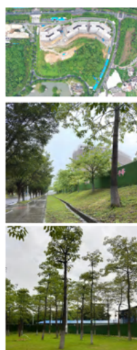
树木规划总平面图