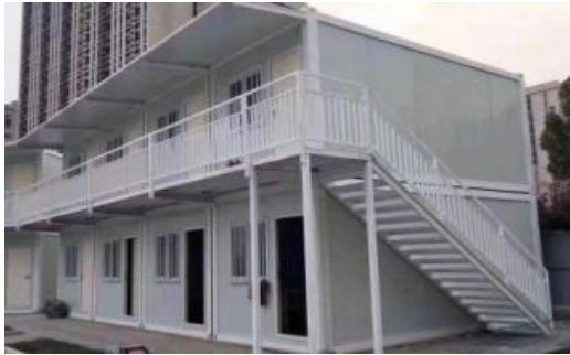
生活区及板房效果