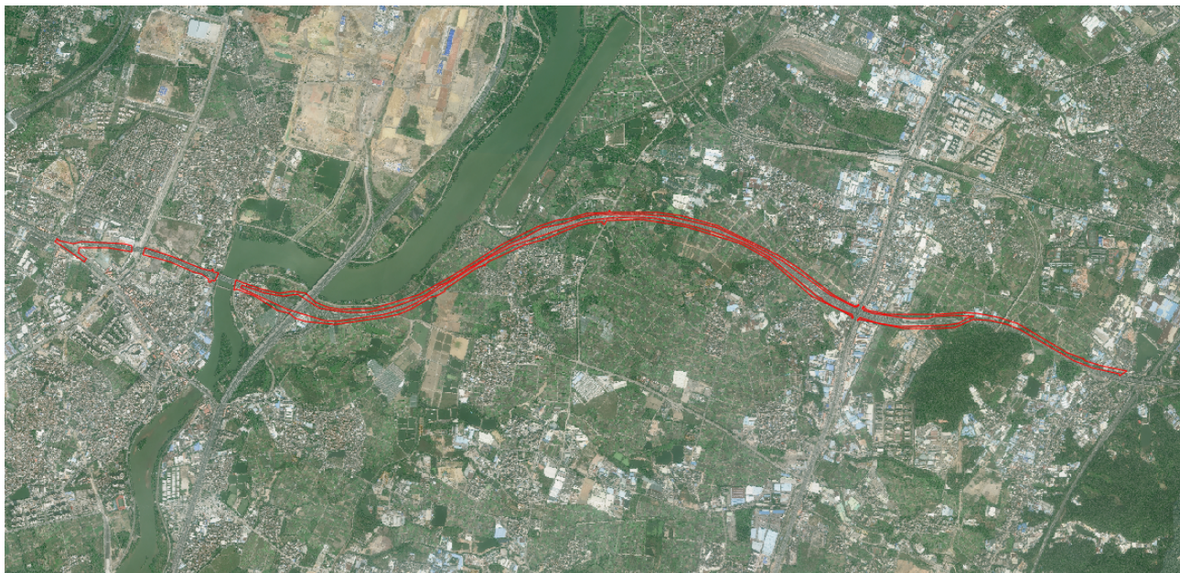
（花莞高速南北辅道）