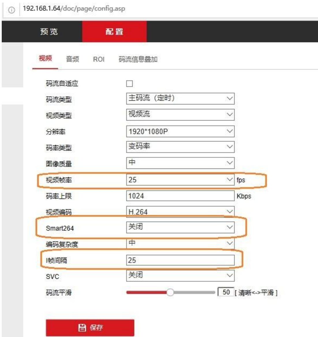
图2: 摄像机音视频配置界面