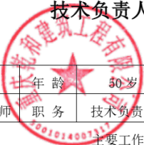
技术负责人简历表