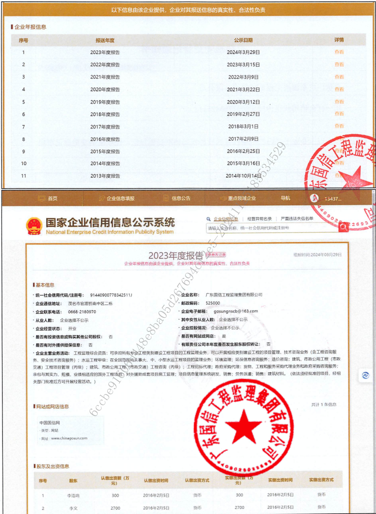
附 1：年检合格的证明材料

查询网址: https://www.gsxt.gov.cn/index.html