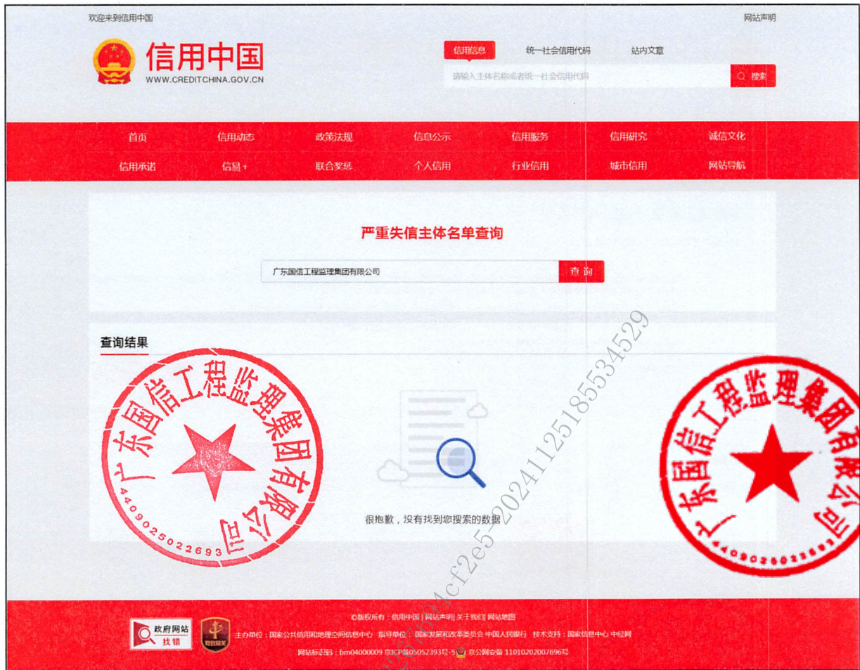
附 2：未被列入严重失信主体查询截图