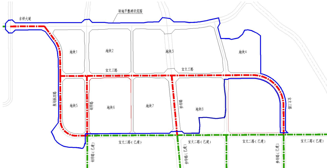
场地平整范围（8个地块）位置图

总投资 99108.87 万元，建安费为 46617.49 万元，建设工程其他费为 48760.19 万元，预备费用为 3731.19 万元。