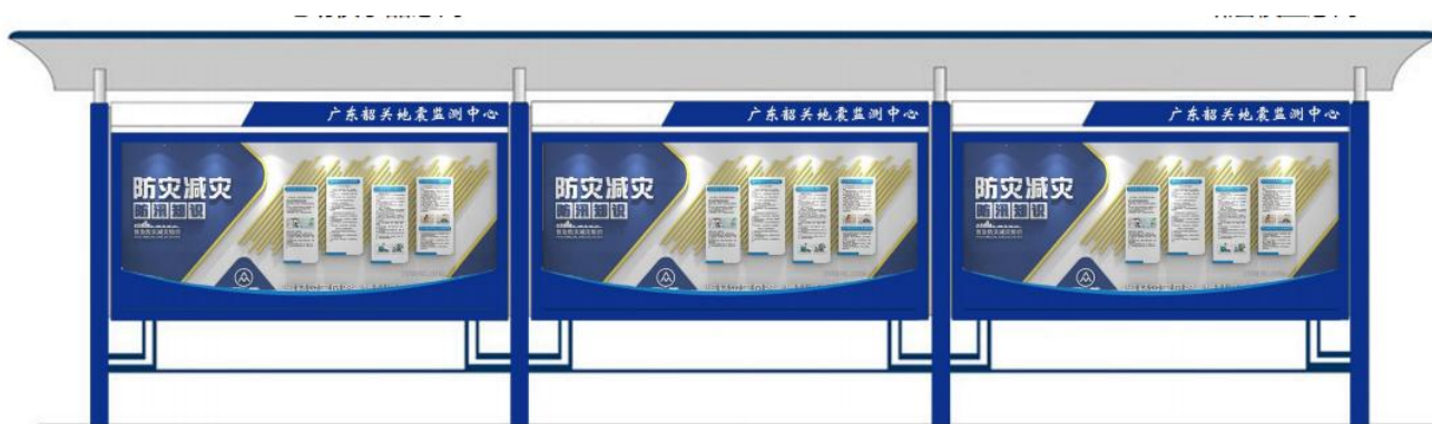
地震宣传展板意向