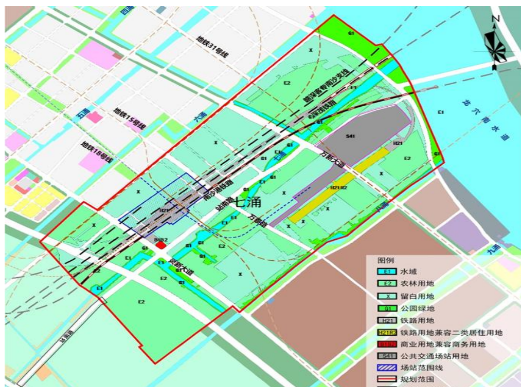
图 2.1 七涌及邻近地区水系规划图

根据在编控规，为满足南沙站南广场建设，将现状七涌向南移动至站南路以南，西侧在灵新大道以西接回现状位置，东侧在与站南路交汇点相接，接回现状位置。南侧通过连接涌与八涌相接，北侧动过连接涌与六涌相连。