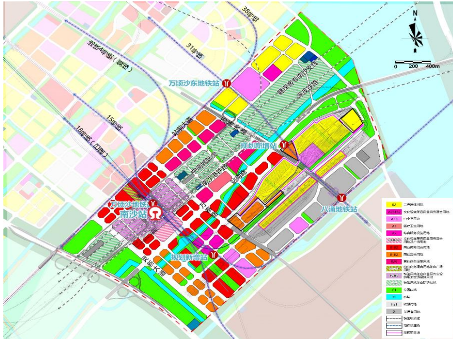
图 2.2 南沙枢纽（场站）周边地区远期用地规划图（在编）

根据南沙枢纽（场站）周边地区在编规划，南沙枢纽周边地区主要规划为商业商务、居住、商住混合用地、综合服务用地、学校用地、交通设施等。