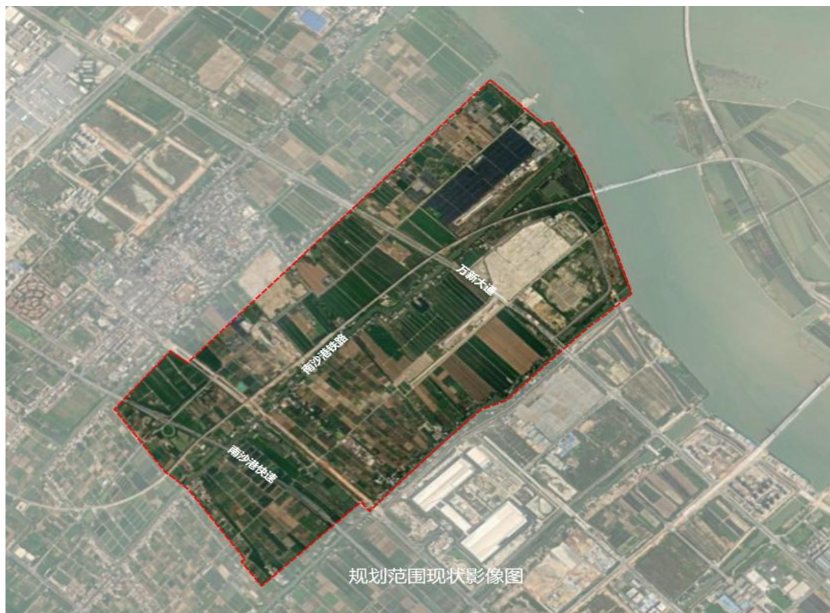
图 1.1 片区规划范围图

南沙枢纽（站场）周边地区地处广州市南沙万顷沙中部，北邻蕉门水道、南临南沙港快速、西近六涌、东靠八涌，用地面积约 852.9 公顷，处位置不仅是珠三角地区的地理几何中心、粤港澳大湾区的重要组成部分，也是中国（广东）自由贸易试验区南沙新区片区的 7 个区块之一。