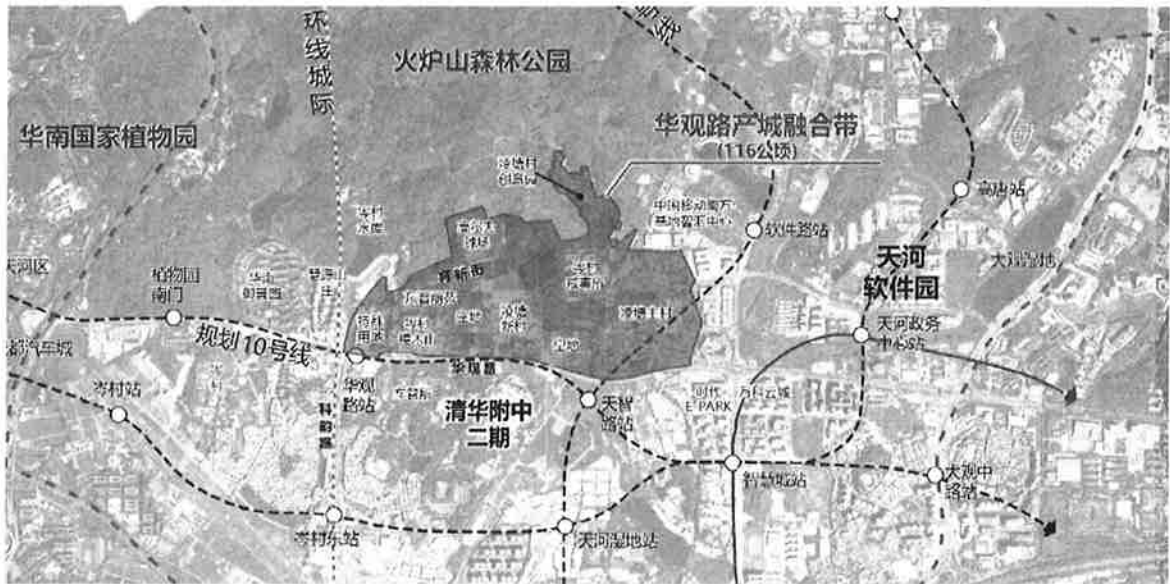
华观路产城融合带工作范围示意图

项目位于广州市天河区智慧城核心区，南起华观路、北至育新街-凌塘村创意园、东至凌塘环村路、西至科韵路。规划（改造）范围 116.61 公顷，其中规划（改造）实施范围 83.69 公顷（具体以最终批复为准），控制性详细规划涉及 AT0303、AT0304、AT0305、AT0308、AT0602、AT0604 规划管理单元（含研究范围 270.88 公顷），总用地面积合计约 1524.62 公顷。